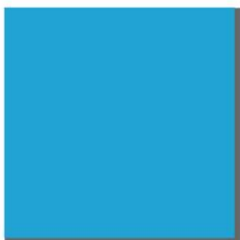
1/1 page 210 x 275 mm* Prix: Fr. .290—